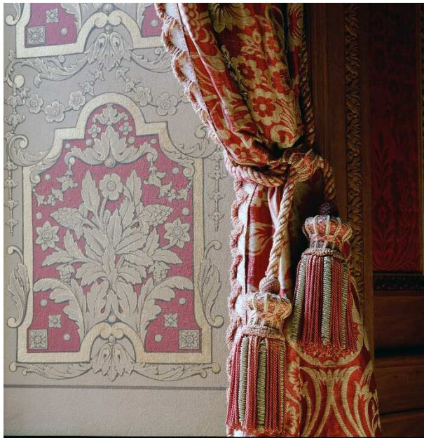
Figuur 1: Gordijnen in de slaapkamer van de baron.

Zowel de casco restauratie als de interieurrestauratie van het Châtelet zijn afgerond in 2015 en afgewikkeld in 2016.