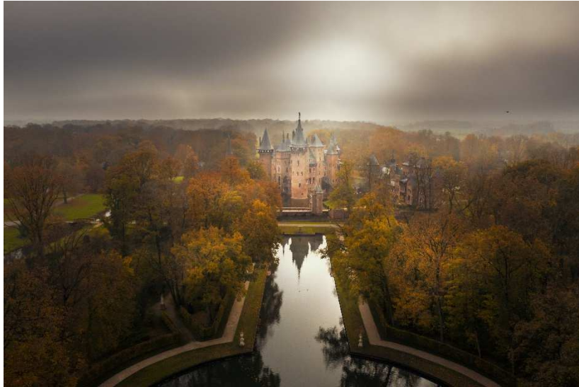
Figuur 3: De Kruisvijver met weerspiegeling kasteel.

Eind 2019 is aangevangen met de restauratie van de Kruisvijver. De kosten worden voor 50% gedekt door een bijdrage van de Provincie Utrecht (€ 195.473). Het resterende bedrag zal Stichting Kasteel de Haar zelf bijdragen. Medio 2021 zullen de werkzaamheden worden afgerond.