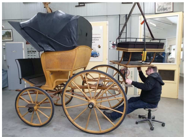
Figuur 2: Restauratie van de Napoleon Phaeton Ingehoes in restauratie-centrum Stolk.

In 2020 is ook de restauratie voltooid van vier rijtuig, voorheen in bezit van baron van Zuylen van Nijvelt van de Haar en thans in bezit van Stichting Paard en Karos. Stichting Kasteel de Haar heeft deze rijtuigen in bruikleen om - met behulp van VZW Natuurbehoud Pater David, Mondriaanfonds, VSB Fonds, Prins Bernhard Cultuurfonds en Stichting Bonhomme Tielens - te restaureren en vervolgens tentoon te stellen. In 2021 zullen enkele rijtuigen reeds te bezichtigen zijn op het Stalplein.