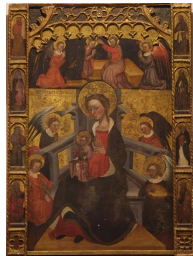
Figuur 2: Getroonde Maria met kind, De kroning van Maria en de Heiligen.