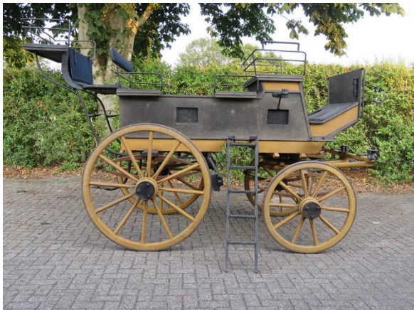
Figuur 1: Char-à-Bancs (jachtwagen). Eerste rijtuig in restauratie.

De restauratie van de overige delen van de bovenste verdiepingen van het kasteel is in 2018 aangevangen en wordt gedekt door rijkssubsidie en de Provincie Utrecht (€ 381.488). In 2018 is tevens aangevangen met de restauratie van het nagelvaste textiel en de gordijnen in het kasteel. Deze kosten worden voornamelijk gedekt door rijkssubsidie (70%), Stichting Dioraphte en Prins Bernhard Cultuurfonds.